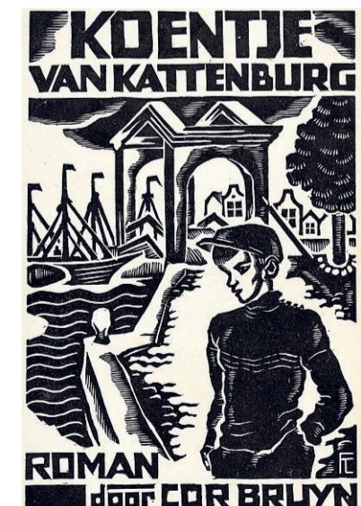
Twee ontwerpen van de hand van Fré Cohen: de roman 'Koentje van Kattenburg' en een brochure van de ANMB.

'Fré Cohen, grafisch kunstenaar' is tot met 4 september 2022 te zien in het Amsterdamse School Museum