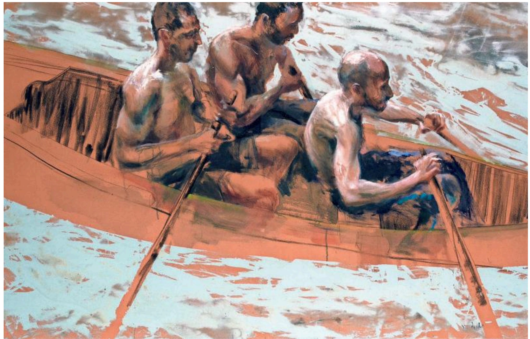
Roeiers door Sam Drukker.

De klassieke schilder gaat niet aan het werk op een wit doek zoals het cliché wil, maar op een doek waarop een 'imprimatuur' is aan-