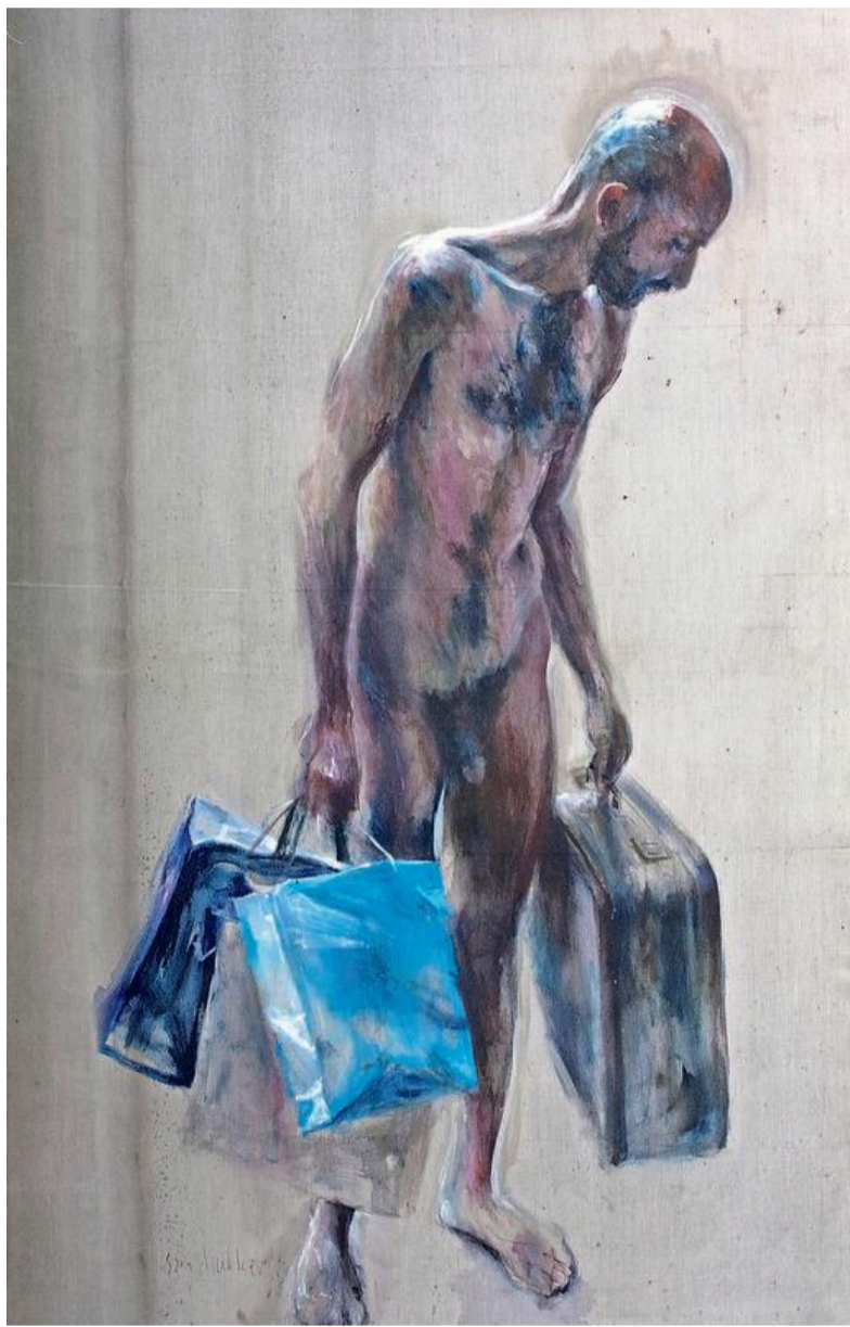
'Man met koffer'.

De kunstenaar studeerde af in aquarel, maar begon zijn carrière als kunstenaar alsnog met olieverf. De technieken van het aquarelleren kwamen hem daarin toch goed van pas: „Ik hou ervan om transparant en schraal te werken. Ik zet liever één veeg raak dan vier. Het mag er uitzien alsof ik mijn kwast even